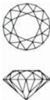
Рис. 8. Полная бриллиантовая огранка

Сущность: Всему окружению показывает себя и говорит: «Посмотрите на меня, обратите на меня внимание». Ловит энергию восхищения и зависти. Очень довольна собой.